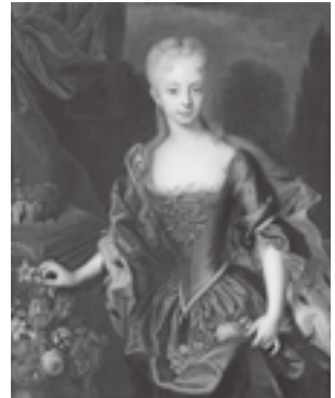
アンドレアス・メラー 「11歳の女帝マリア・テレジア」 1727年 (ウイーン美術史美術館蔵)