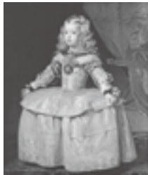
ディエゴ・ベラスケス「白衣の王女マルガリータ」 1656年頃 (ウイーン美術史美術館蔵)

1869年に日本とオーストリア・ハンガリー二重帝国が国交を樹立し140年が経つ。本展はこれを記念して、600年以上の長きにわたってヨーロッパに君臨した名門王家ハプスブルグ家ゆかりの品々を並べる。マクシミリアン1世の宮廷画家デューラー、スペイン王フェリペ4世の宮廷画家ベラスケス、ネーデルランドのアルブレヒト大公の宮廷画家ルーベンス、さらにラファエロ、ティツィアーノからゴヤまで、16世紀から18世紀にかけてのヨーロッパ芸術最盛期の名画は圧巻。また皇帝たちを魅了し、宮廷を飾った工芸や武具の数々は、意外にも同時代の日本の美術工芸と同調する点が少なくない。芸術を庇護し愛し続けた王家の栄華を物語る名品の数々を堪能できる。なお特別出品として、明治天皇からオーストリア・ハンガリー二重帝国(当時)に贈られた画帖と蒔絵棚が両国友好の歴史を辿る品として初めて里帰り展示される。