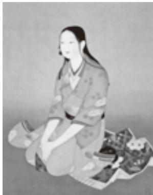
「朱唇」 1931年 (京都国立近代美術館蔵)

生誕130年を記念して開催する本展では、初期から晩年までの代表作はもちろん、新出作品、滞欧期の模写、写生帖など約75点を展覧し、菊池契月の芸術世界に迫る。