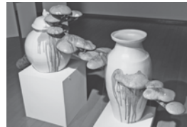
榎本佳子「松/壺」2010年 h90×150×50 陶

「Girl by Girl」 Foundry gallery (上海) 「Animamix Biennial 2009-2010」 上海当代美術館 (上海) 2010年 「俗なる美意識」 イムラアートギャラリー (京都) 「共鳴する美術2010-ストーリー・テリング」 倉敷市立美術館 (岡山)