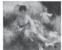
ピエール・オーギュスト・ルノワール 「日傘をさした女性と子ども」 1874-6年頃