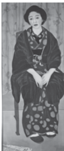
梶原緋佐子 「帰郷」 1918(大正7) 年頃