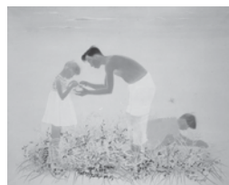
三谷十糸子「朝」 1937(昭和12)年