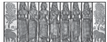
秋野不矩「七母神」 1984(昭和59)年