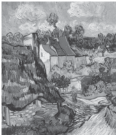
フィンセント・ファン・ゴッホ 「オーヴェールの家々」1890年頃

米国で最も歴史ある美の殿堂のひとつ、ボストン美術館から西洋絵画の傑作80点が京都にやってくる。16～17世紀のオールドマスターから、印象派をはじめとする19世紀フランス絵画の名作、さらに20世紀のピカソやマティスに至るまで、美術史にその名を刻む巨匠達の名作が一堂に会する本展は、いわば「名画のフルコース」。この夏は京都で贅沢な巨匠達の饗宴に酔いしれてみたい。