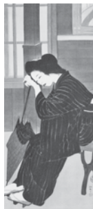
梶原緋佐子 「ねがい」 1919(大正8) 年頃