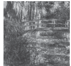
クロード・モネ 「睡蓮の池」1900年