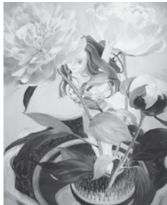
龍門 藍「生け花」2010年 162×130cm油彩

本展覧会では、龍門藍は大作 (h180×330cm) を含めた新作を中心に約5～7点を、榎本佳子は関西では初出展の作品を約4点発表します。二人による「Mélange (メランジュ=フランス語で混合の意味)」をお楽しみください。