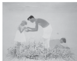
三谷十糸子「朝」 1937(昭和12)年