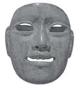
「ヒスイのマスク」 紀元前12世紀頃 (パラバ人類学博物館蔵)

オルメカ文明とは、マヤ文明を遡ること紀元前1200年頃、メキシコ湾岸地方に突然あらわれた新大陸でもっとも初期の古代文明である。文明を築いたのはベーリング海峡を渡ってきたモンゴロイドの人びとで、巨大な石を彫刻し、土造りのピラミッド神殿などを築く建築技術、ヒスイなどの玉石を精緻に加工する技術をもっていた。マヤ文明など中米古代文明に共通する美術様式や宗教体系などから、新大陸の「母なる文明」と呼ばれている。