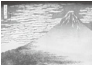
「富嶽三十六景・凱風快晴」 (前期: 2/1 - 2/26 展示)