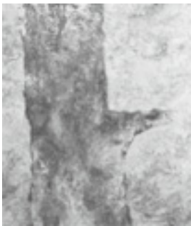
「閑林」 - 4