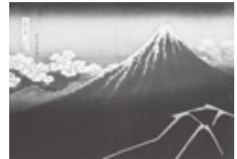
「富嶽三十六景・山下白雨」 (後期: 2/28 - 3/25 展示)

開催します。第1章では、デビュー当時の「春朗」時代の作品から最晩年の「地方測量図」までを年代別に展覧して北斎の画業を辿り、第2章では、北斎の晩年の代表作「富嶽三十六景をはじめ「諸国名勝奇覧」「諸国瀧廻り」「琉球八景」「詩可写真鏡」「百人一首姥か絵説」といった6種の揃いものを紹介します。北斎芸術の心髄に触れる絶好の機会となることでしょう。