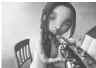
「Staccato スタッカート」(技法: Digital)