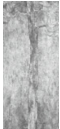
「閑林」 - 1