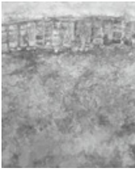
「閑林」 - 3

と き / 2月7日(火)～2月29日(水) 11:00AM～7:00PM ところ / 画廊後素堂 (日祝休廊) 京都市中京区新町丸太町下ル ☎075-231-0938