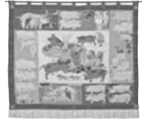
中村鵬生「献身之秋」(織物)