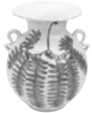
河合卯之助 「孔雀歯染付花瓶」 1940年頃