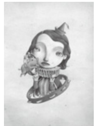
「Tambourine player タンバリン奏者」