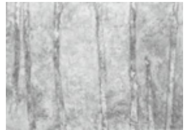
「閑林」 - 2