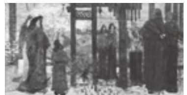
青木 繁「光明皇后」1905年