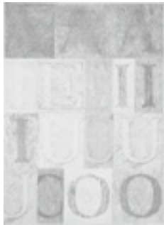
「アルファベット(AEIUO)」 1975 シルクスクリーン (国立国際美術館蔵)

関根勢之助(1929-2003)は京都市立美術専門学校(現京都市立芸術大学)を卒業し、独立展に入選、その後「ゼロの会」や「VOLの会」を設立し、絵画を起点としながら先鋭的かつ実験的な制作を続けながら多くの美術家・研究者との交流を通して幅広い活動を行った。1967年から母校の教壇に立ち、76年に教授となり構想設計学専攻の基盤を作り、多くの優れたアーティストや様々な領域で人材を輩出、94年に退官した。2003年に京都市文化功労者として顕彰された。