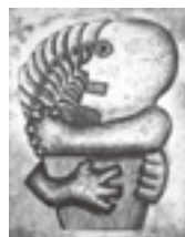
深沢幸雄 1958 銅版