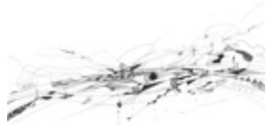
「夜明け」 22×31cm ケント紙にボールペン