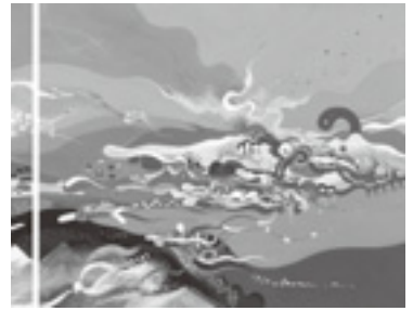
「空のかくしごと」 38×45.5cm キャンバスにアクリル

2004年 京都精華大学芸術学部デザイン学科ビジュアルコミュニケーションデザイン専攻 卒業 グループ展、イベント参加、ライブペイント出演など多数