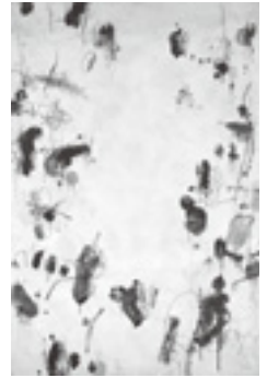
「6月の扉」1964年 (京都国立近代美術館蔵)

本展は、絵画と美術・教育などを束縛する制度的な思考と戦いながら同時に詩情あふれた制作活動を行った関根勢之助の軌跡を辿るものである。初期の抽象絵画から、目を閉じて描かれた「ブラインドドローイング」などの実験的な作品や立体の小品ほか、「VOL」など多くの資料を展示し、その活動の全貌を展観する。