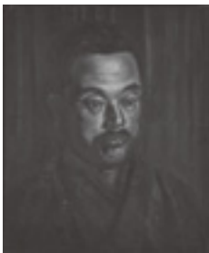
椿 貞雄「芝川照吉像」 1920年

と き／5月18日(土)～6月30日(日) 9:40AM～5:00PM ところ／京都国立近代美術館 (月曜休館) 京都市左京区岡崎公園内 ☎075-761-4111