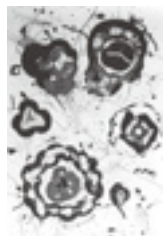
サム・フランシス 1986 銅版