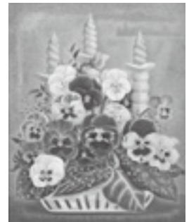
岡鹿之助「捧げもの」