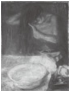
坂本繁二郎「髪洗い」 1917年

明治から大正にかけて毛織物貿易で巨富をあげ「羅紗王」とよばれた大阪の実業家芝川照吉(1871-1923)は、日本洋画家の援助をつづけ膨大なコレクションをつくりあげた。青木繁と坂本繁二郎、岸田劉生をはじめとする草土社グループ、浅井忠や石井柏亭とその仲間たち、藤井達吉や富本憲吉ら近代化を目指した工芸家たちも芝川の援助を受けた。夏目漱石との交流も語られるなど文化的土壌もめぐまれていた。質量において圧倒的であったコレクションだが、芝川の没後は関東大震災に遭いほとんどが散逸してしまった。