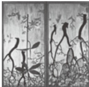
藤井達吉「草木図屏風」1916年頃