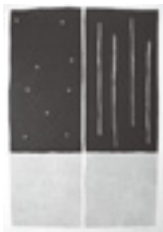
山中 現 1989 木版画

【展示作家名】 舟越桂／山本桂右／深沢幸雄／北川健次／山中現／藤田修／利渉重雄／武田史子／黒田克正／ソル・ルウィット／ロバート・マンゴールド／サム・フランシス／他