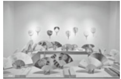
会場スナップ (昨年度)

若手日本画家などが制作した扇子・団扇展をギャラリーマロニエ、アートスペースMEISEI、マエダ・ヒロミアートギャラリーの3軒で開催する。昨年と同じ展覧会では日程が各ギャラリーで違ったが、先行1年早く扇子・団扇の展覧会をしていたギャラリーマロニエが声をかけ3ギャラリー同時開催となる。ギャラリーマロニエでは若手日本画家を中心にしたメンバーで、日頃の制作を扇子・団扇のかたちのなかで各作家が表現していく。会期中の週末には出品作家による扇子のワークショップも開催される。(※要問い合わせ) アートスペースMEISEIでは、扇子職人と若手日本画家による舞扇子と普段使いもできる扇子を展観する。マエダ・ヒロミアートギャラリーでは日本画・洋画・テキスタイルの他ジャンル作家の扇子を展観する。