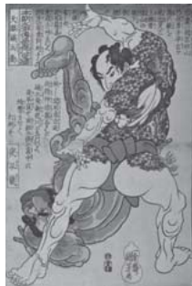
「本朝水滸伝豪傑 八百人一個 天眼礪兵衛 夜叉嵐」 (通期展示)

幕末期に活躍した浮世絵師・歌川国芳(1707-1861)は、江戸期を代表する絵師のなかでも型破りな表現で異才を放っている。画面一杯に巨大な鯨や骸骨が登場するダイナミックな作品、人が集まって顔を形づくる「寄せ絵」や擬人化された猫や金魚の絵など、斬新な発想力とユーモア溢れる作画から、「奇想天外な劇画家」と呼ばれ、近年評価が高まり人気を博している。