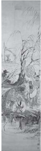
「太公望之図」 1884-85 (明治16-18) 年頃

『我楽多珍報』(1880 明治13年)などの風刺画や徳富蘇峰の『国民新聞』での挿絵、日清戦争に従軍して出版した『日清戦闘画報』(1895 明治27年)などを通して、近代ジャーナリズムの世界では著名な久保田米僊(1852-1903)。