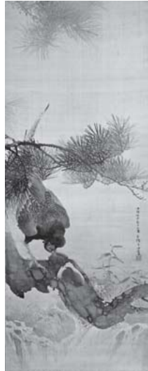
「雉子之図」 1886 (明治19) 年

パリ万博(1893 明治16年)で受賞し渡欧、シカゴ万博(1893 明治26年)でアメリカに渡り見聞記を『国民新聞』で連載し、それぞれ帰国後に画報や画集を出版した。一方京都府画学校の開設(1878 明治13年)に尽力し、明治中期の京都日本画壇に多大な貢献を果たしたが、その偉大な足跡を検証する機会にはこれまで一切恵まれなかった。