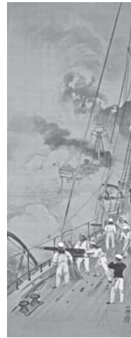
「日清戦勝図」 (3幅対のうち) 1894-95 (明治27) 年頃