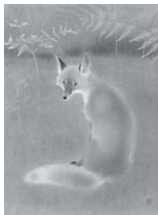
山口華楊「叢原」 1971(昭和昭和46)年 名都美術館蔵

文化勲章は、自然、社会、人文の各科学分野および芸術などの分野にたずさわりの創造的発展や向上に卓絶した功績のあった者に授与される勲章で、文化に関わる最高位のものでされている。昭和12(1937)年の春に第1回授章式がおこなわれて以降、今日まで日本画で文化勲章を受章した作家は39人に及ぶ。そのうち京都画壇では、竹内栖鳳、上村松園、西山翠嶂、堂本印象、福田平八郎、徳岡神泉、小野竹喬、山口華楊、上村松篁、池田遙邨、秋野不矩の11人が受章した。