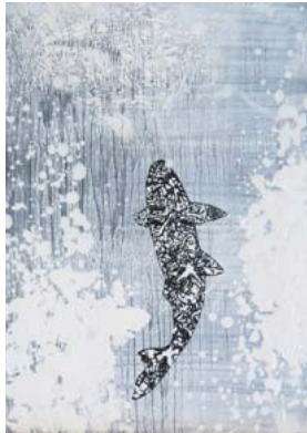
鯉魚登瀛図-アルカディアへ 2015 和紙・墨・雲母粉

片山氏は、前回発表の「螺旋」シリーズと同じく和紙に墨で描く手法を用いて内包する命(生と死)について「ひまわりの花の中心」や「幾重にも重なり合う蝶で描かれた轆轤」、「鯉」等を対比させながら「メメント・モリ(死を忘れるな)」と問いかけます。