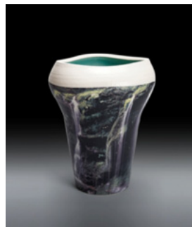
陶器と写真のコラボ