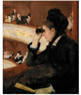
「粧敷席にて」1878年 (ボストン美術館蔵)