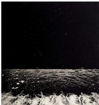
「岬の水際から II」2015年 38.5×36.5cm 銅版画

作者の主技法であるフォトエッチングは、写真がイメージの起点を成すが、そこに内的なヴィジョンが複雑に織り重ねられていく過程が介在する。強いマチエールは、普遍化された場所性と、作者の精神性の刻印であり、堆積した深遠な時間を湛えている。