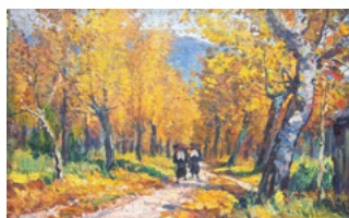
都鳥英喜「八瀬の秋」 大正前期頃