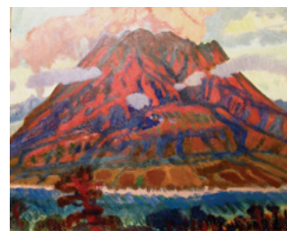
伊谷賢蔵「櫻島と噴煙」 1960（昭和35）年