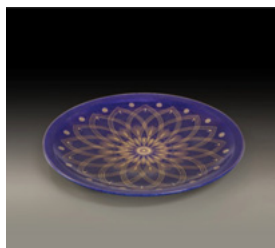
陶器と截金のコラボ