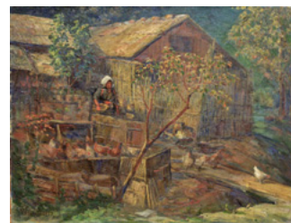
伊藤快彦「農家の秋」 明治末期頃