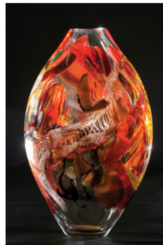
「恋から生まれるもの」 8.5×30×11.5cm