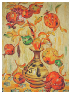
里見勝蔵「柘榴」 1931（昭和6）年頃