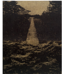
「橋による境界」2013年 50×40cm 銅版画