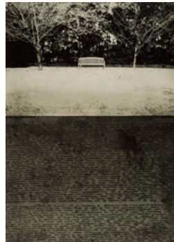
「土壌と長椅子」2013年 52.3×33cm 銅版画

10月8日(土)夕刻5時より作者を囲んで記念レセプション開催する。詩人・美術評論家の建島哲氏による特別寄稿を掲載した個展パンフレットも配布。