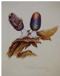
「ジクホコリ (変形菌)」