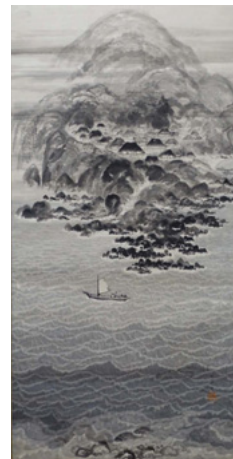
「想い出の伊豆大島岡田村」 1955 (昭和30) 年頃 132.8×66.9cm 紙本墨画／軸装

今回は新出作品を含め、軸装や額装を新たにしたものを含めて30点全て展示即売致します。是非ご高覧ください。