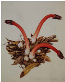
「キツネノタイマツ」