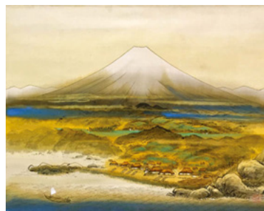
「山海図」 大正末～昭和初期頃 41.9×51.4cm 絹本彩色／額装

そうした評判がまるで不染鉄の描いた波の如く関東平野へ浸潤していった。会期中に展覧会図録が4,000部も売れ、同館開館以来という観客が押し寄せたという。画家人生の大半を過ごした奈良県立美術館での展覧（9～11月）では、新発見作品が勢揃いしたこともあり、正倉院展を押しつけてこれまた新たな感動を呼び起こした。この2月24日にNHK日曜美術館での放送があり、3月初旬に求龍堂から『不染鉄画集』の出版が予定されている。