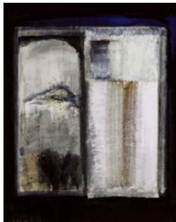
「行きつかなかったシャトー」 2015年