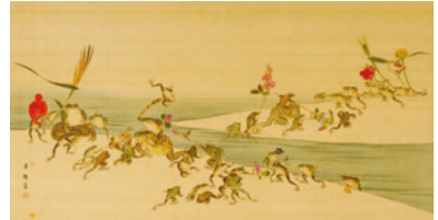
幸野楳嶺「春秋蛙合戦図」 1864年頃 京都国立近代美術館蔵

1868年に明治時代に入ると、政府主導のもと殖産興業や輸出振興政策が押し進められ、1873(明治6)年のウイーン万国博覧会へ日本が正式に参加することで日本の工芸品への関心が世界的に高まることになった。これを受けて政府は国家戦略として工芸図案の指導に力を注ぐ様になり、全国の工芸家へ与える図案の修正などをおこなった。