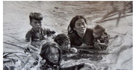
「安全への逃避」1965年9月 (1966年ピュリッツァー賞)

1965(昭和40)年からベトナム戦争で米軍に同行取材し、最前線で激しい戦闘や兵士の表情などを数多く写真に納めた写真家、沢田教一(1936-70)。輝かしい実績を残し、〈安全への逃避〉でピュリッツァー賞を獲得しています。