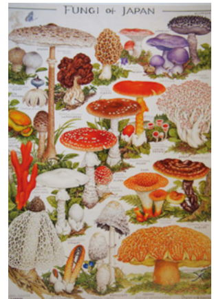
「展覧会案内ちらしより」

菌類が子孫を残すために地上に出す“きのこ”もまた、思い出の装いを凝らして気まぐれにそこに佇んでいる。そんな神出鬼没な野生きのこ（菌類）の肖像画なので『菌類画』と名付けてみた。このちいさい菌類画の窓を覗いて、色も形もさまざまなきのこ達との出会いをお楽しみいただければ幸いです。（小林路子）