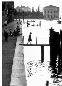
「ホンダメンタ・ヌオー ヴェ、ヴェニス」 1959年