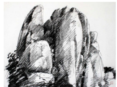
「Mt.バッファローのカテドラル」(1984)