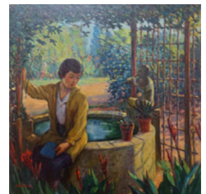
霜鳥之彦「初夏の庭」 1929（大正14）年頃 70.3×70.0cm