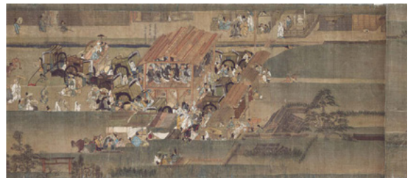
国宝 一遍聖絵 巻7（東京国立博物館蔵）

踊り念仏で知られる時宗は、宗祖一遍（1239～89）が鎌倉時代に開いた宗派です。一遍は念仏をとなえることで誰もが往生をとげられると説き、全国を行脚（遊行）して、念仏札を配り（賦算）、布教につとめた。この時宗を教団として整備し、大きく発展させたのが二祖の真教（1237～1319）である。2019年に真教の七百年遠忌を迎えるのを記念して、時宗の名宝を一堂に会する展覧会が開催されている。