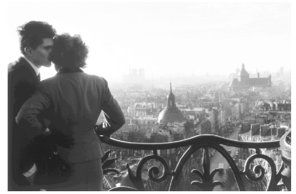
「バスターユの恋人」1957年

パリに生まれたロニスは音楽家を志しますが、父の写真館を継ぐ形で写真の世界に入ります。そこからロニスは写真家として才能を発揮し、優れたルポルタージュ作品をはじめ、広告、ファッションなど、多方面に渡って活躍しました。まさに20世紀の証人ともいえるロニスですが、その中でも身の周りにある、ふとした日常の時間を切り取った写真には独自のユーモアと温かさが光ります。