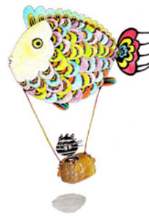
「世界旅行一行ってきます」