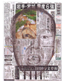
「新聞と自画像、2008.6.15 中国新聞」 2008年、えんびつ、色鉛筆、水性ペン、墨、水彩・紙