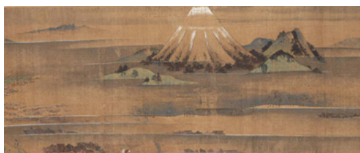
国宝 一遍聖絵 巻六（この場面は後期展示） （東京国立博物館蔵）

本展では、全国各地を遍歴した一遍の生涯を描いた国宝「一遍聖絵」（清浄光寺（遊行寺）蔵）をはじめ、真教の足跡もつづられた「遊行上人縁起絵」、一遍や真教ら歴代祖師の肖像画や肖像彫刻など、時宗の名宝の全貌が紹介されている。なかでも、日本を代表する絵巻であり、中世の歴史を語る上でも重要な作品である「一遍聖絵」については、12巻全巻が公開されている。近年再評価の動きが強まっている異色の日本画家・不染鉄が、京都市立絵画専門学校在学中に「一遍