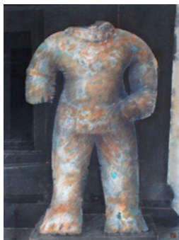
「アンコールの守護神」(2001)

尚、6月2日まで奈良県立美術館で回顧展「ヨルク・シュマイサー 終わりのなき旅」を開催中。