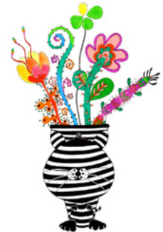
「ゼブラニャンニャンパラダイス」