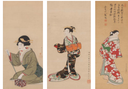
祇園井特 「紐を結ぶ女」 月岡雪鼎 「遊女」 宮川長春 「立ち美人」

鮮やかな色彩で摺られた版画のイメージが強い浮世絵ですが、肉筆画は量産される錦絵の版画と違い、浮世絵師が絹本・紙本に直接描く一点物。本展では貴重な肉筆画を、美人画を中心に約110点を展示。絵師の手によって華麗な衣装の文様まで精緻に描かれた、濃密で、優美な浮世絵の世界を楽しむことができます。国内でも有数の肉筆浮世絵コレクションを擁する、岐阜県高山市の光ミュージアム所蔵の珠玉の名品は今まで一挙公開される機会がなかったため、本展が初の大規模公開となります。