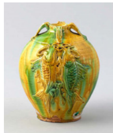
河井寛次郎 《三彩双魚文瓶子》 1922 (大正11) 年 京都国立近代美術館蔵