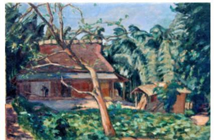
太田喜二郎「賀茂の農家」 1920（大正9）年 49.2×73.7cm

太田喜二郎、赤松麟作、跡見泰、安藤義茂、伊藤快彦、池田治三郎、鹿子木孟郎、川端弥之助、黒田重太郎、国盛義篤、澤部清五郎、霜鳥之彦、須田国太郎、山田新一